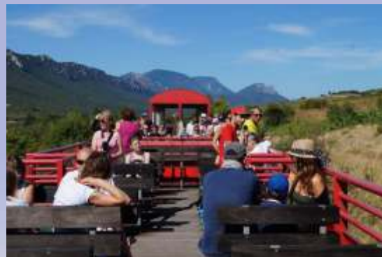
Commentaire des parcours par un agent d'accueil